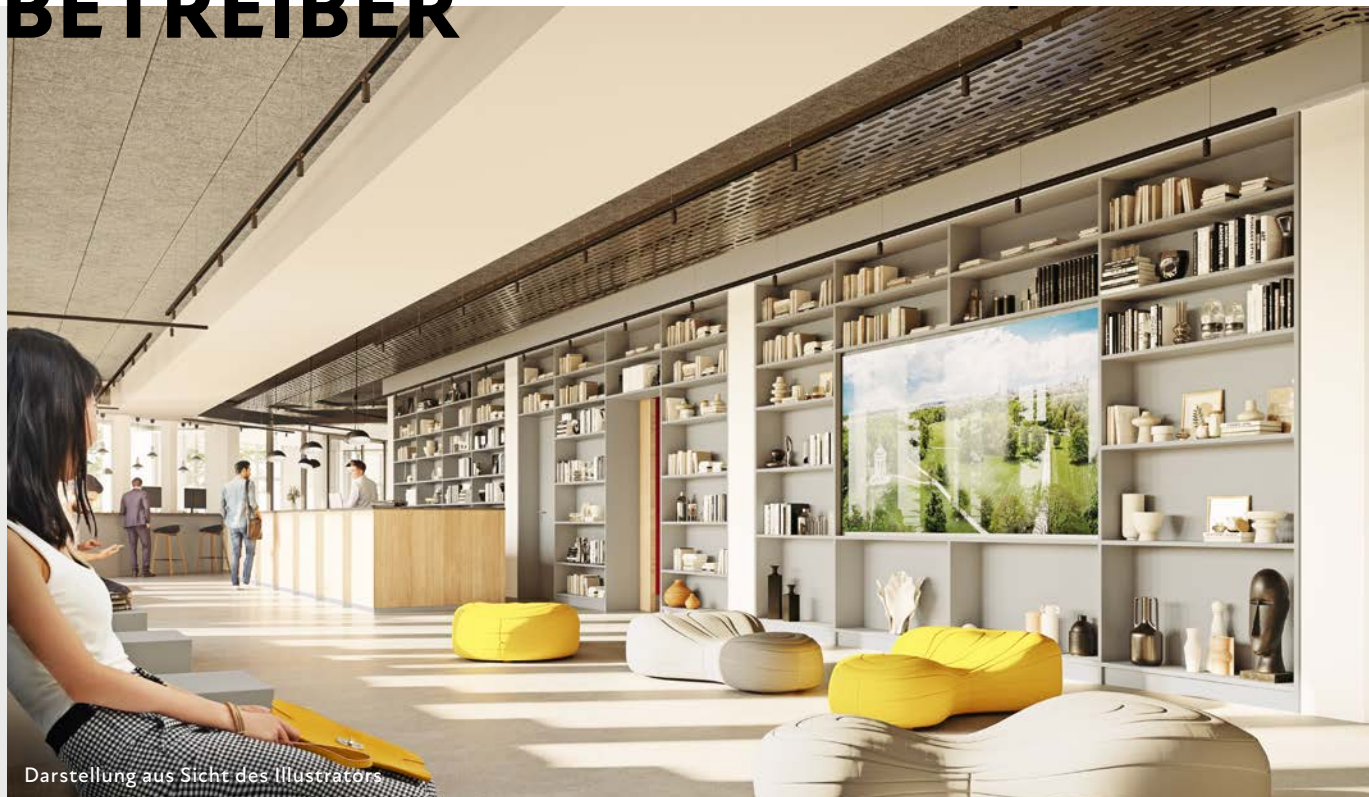
Darstellung aus Sicht des Illustrators

Ihr Immobilieneigentum vermieten Sie auf Dauer zu einer vertraglich abgesicherten und indexierten Miete an einen erfahrenen Betreiber. Sie müssen sich weder um die laufende Vermietung noch um die Instandhaltung kümmern. Das erledigt alles der Betreiber und die Verwaltung für Sie. Bei Ihnen verbleibt ein „Rundum-sorglos“-Paket.